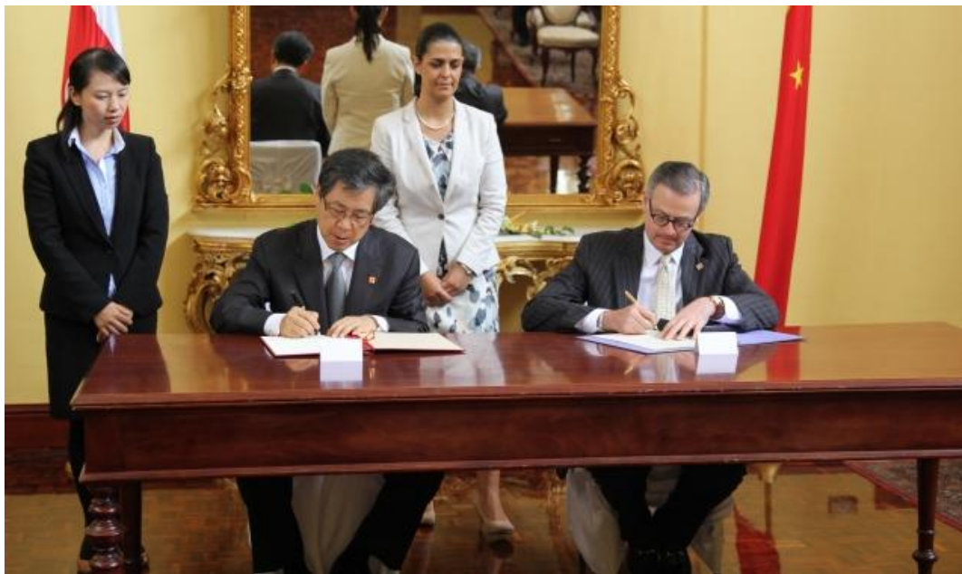
El Canciller Manuel A. González y el Embajador de China Song Yanbin durante el acto de firma del Convenio

En el Salón Dorado de la Cancillería, el pasado viernes 11 de diciembre del 2015, se realizó la ceremonia de suscripción de un Convenio de Cooperación Económica y Técnica entre la República de Costa Rica y la República Popular China , por un monto total de 150 millones de yuanes de Renminbi (los cuales equivalen aproximadamente a 24 millones de dólares estadounidenses). Estos recursos no reembolsables, corresponden a la cooperación que el Presidente Xi Jinping anunciara al Presidente Luis Guillermo Solís Rivera, durante su visita a China, efectuada en enero del 2015.