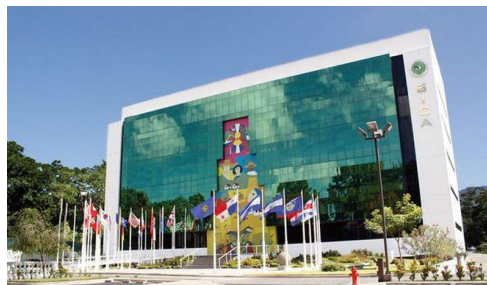
Sede de la SG-SICA, ubicada en San Salvador

hubo una retroalimentación del ejercicio por parte de la Sociedad Civil Organizada, a cargo de un representante del Consejo Consultivo del SICA.