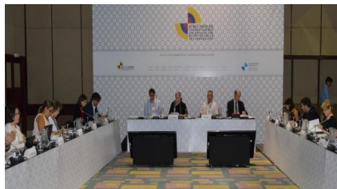
Mesa de la Reunión de Responsables de Cooperación

Del 9 al 11 de diciembre de 2015, en el marco de la Conferencia Iberoamericana, se realizó en Cartagena de Indias, Colombia, la II Reunión de Responsables de Cooperación (RRC). Esta reunión constituyó un importante avance en la cooperación iberoamericana, en lo que a objetivos y procedimientos se refiere.