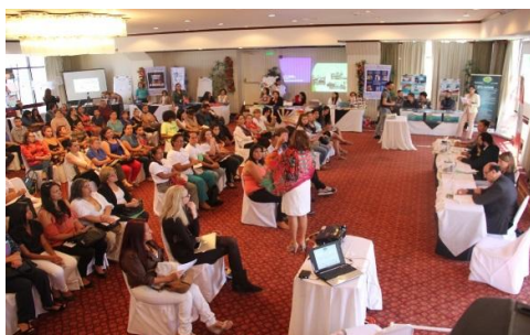
Evento en San José del Proyecto B.A.1 de la ESCA

En el marco del Proyecto B.A.1 Prevención de la Violencia contra las Mujeres en Centroamérica , de la Estrategia de Seguridad de Centroamérica (ESCA), se realizó el 16 de diciembre del 2015, en San José, el Festival de Buenas Prácticas para Prevenir la Violencia hacia las Mujeres .