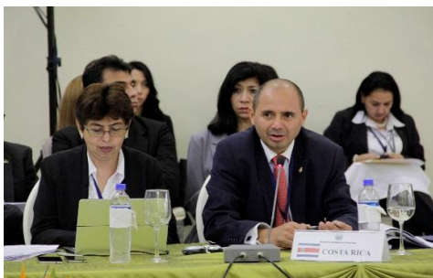
Delegación de Costa Rica en reunión del SICA

El 17 de diciembre del 2015 se efectuó la reunión del Consejo de Ministros con representantes de los países observadores del SICA. En el transcurso de este encuentro, se realizó una presentación sobre la situación actual del proceso de la integración regional y sus avances. Asimismo, se estableció un diálogo sobre las prioridades de cooperación del Sistema, sustentadas en la aplicación operativa de los principios de la Declaración de París, relacionados con el proceso de armonización y alineación de la