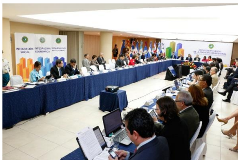
Reunión de la Mesa de Cooperantes en El Salvador

sede de la SG-SICA en El Salvador. Los temas tratados en la actividad, fueron los avances y desafíos en el proceso de eficacia de la cooperación regional, así como las áreas prioritarias de cooperación del SICA.